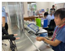
新大牟田駅でのお仕事体験(昨年8月19日)

JR九州主催のお仕事体験イベント「新幹線のお仕事チャレンジ！」新大牟田駅と保守基地に潜入せよ。10月26日、開催されます。昨年夏に大好評だったことから、今年も開催が決定。9月26日から10月9日まで参加者を募集します。大牟田市後援。