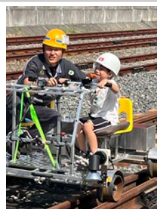
新大牟田保守基地でのお仕事体験